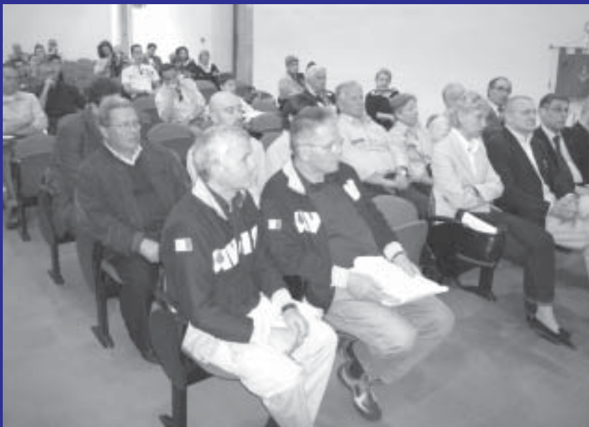
Nelle foto alcuni momenti della manifestazione